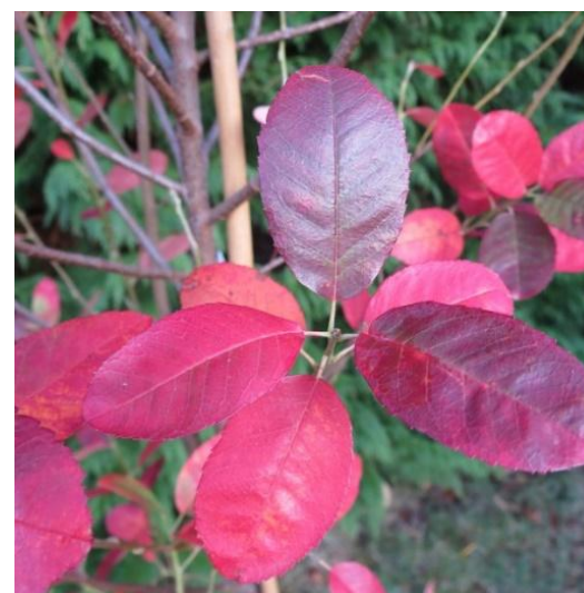
The 'June Berry'

Arbuste à feuilles caduques, fleur printanière super précoce, fruits comestibles en juin (semblable à une myrtille) Couleur d'automne fantastique.